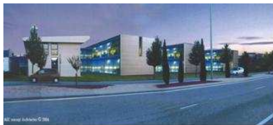
Perspective extension du Technosite

Rappelons que cette extension permettra de dégager près de 1 600 m 2 de plancher supplémentaires pour accueillir de nouveaux projets à valeur ajoutée technologique.