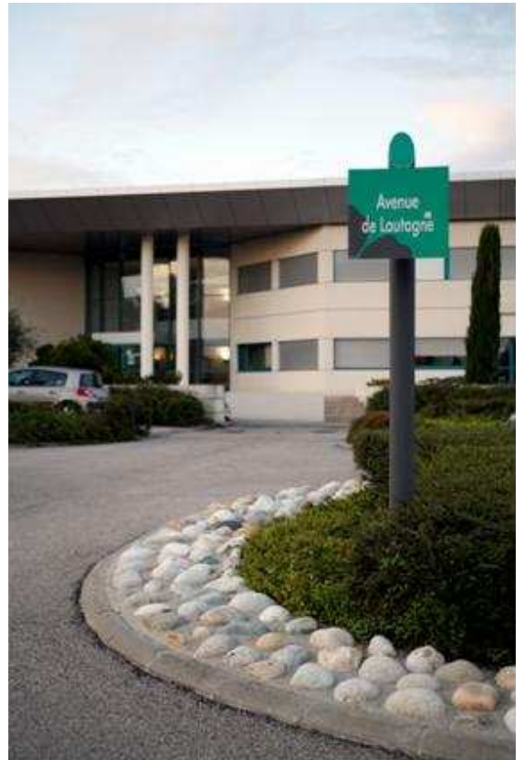
Maison du BTP Lautagne