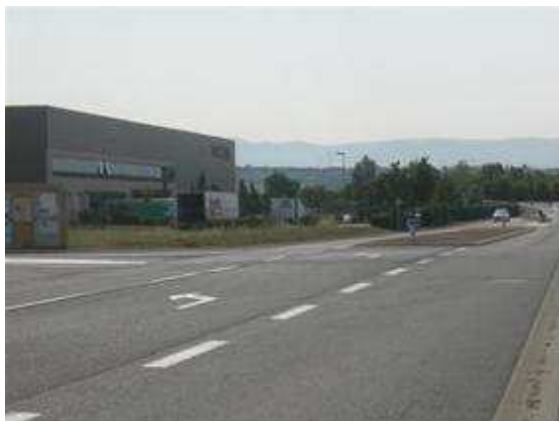
Rue Cdt Cousteau ZAC Chaffit

IXIS AEW constitue une réelle zone d'ombre pour la zone intercommunale portoise. A noter toutefois que cette situation ne constitue pas un cas isolé en vallée du Rhône, les bâtiments de Montéleger, du Pouzin ou encore de Saulce sur Rhône n'ont pas non plus trouvé preneur au 31 décembre de l'année.