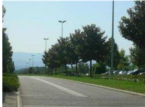
Avenue de Lautagne

Le dernier terrain du Lotissement de Lautagne a été cédé durant l'année, et verra l'implantation de la société PRODIM sur plus de 1500 m 2 de bureaux. Au total, ce sont 9,8 ha de terrains commercialisés sur un périmètre d'environ 18 ha. Une réflexion est en cours pour envisager la suite de l'opération laquelle s'avère complexe de par la nécessité de réactualiser l'ensemble des études eu égard notamment à l'évolution du contexte réglementaire et au retour d'expérience de plusieurs années de commercialisation. Un bureau d'étude sera à ce titre désigné dès début 2008 pour une assistance à maîtrise d'ouvrage.