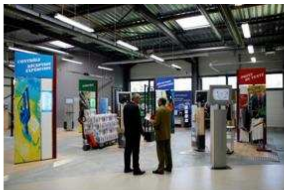
Le centre de démonstration du Techosite